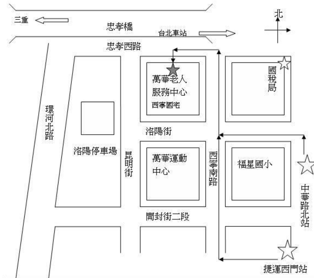
臺北市萬華老人服務中心 位置圖